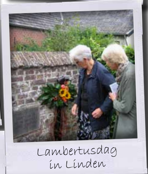
Lambertusdag in Linden