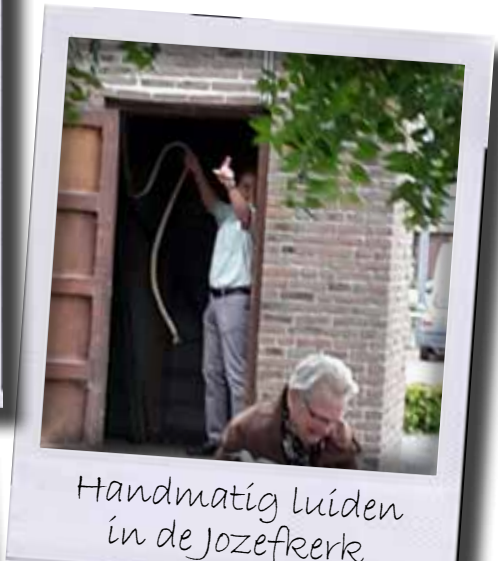
Handmatig luiden in de Jozefkerk