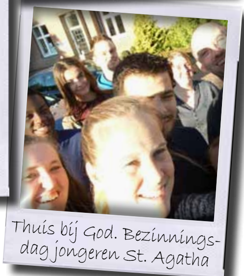
Thuis bij God. Bezinnings- dag jongeren St. Agatha