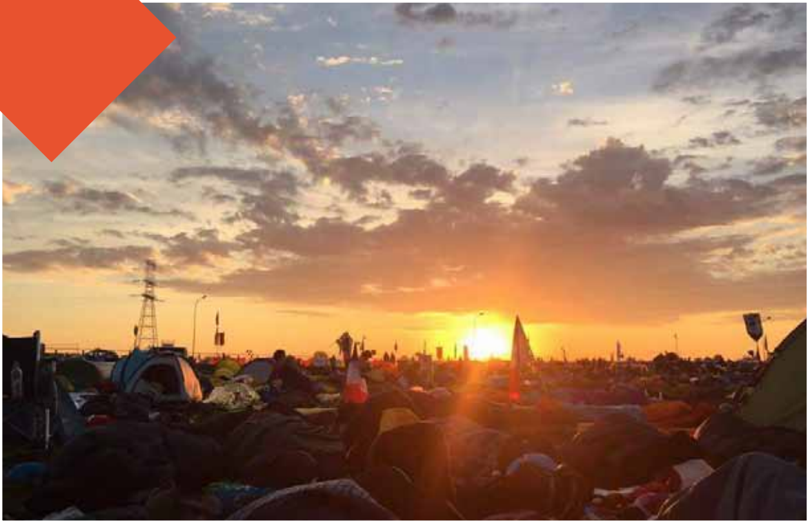
Zonsopgang WereldJongerenDagen in Krakau