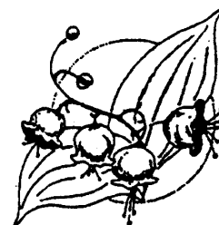
"Werkgroep voor ouderen en zieken"

Wij hopen dat er veel kinderen naar deze viering komen.