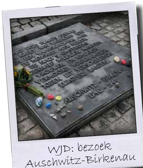
WJD: bezoek Auschwitz-Birkenau