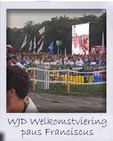
WJD Welkomstviering paus Franciscus