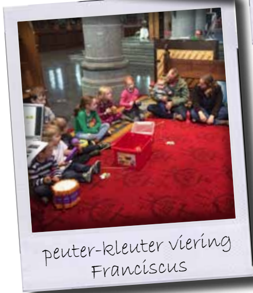
peuter-kleuter viering Franciscus